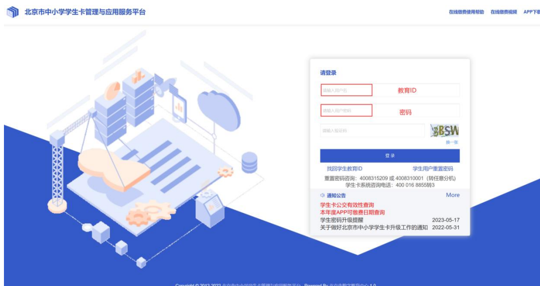
学生卡管理系统首页