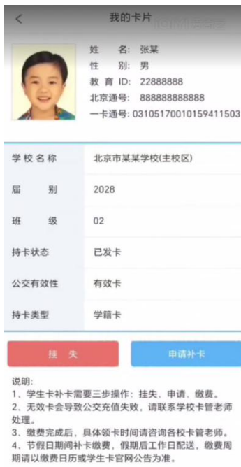
核对照片和学校名称等信息 (如信息有误请联系学校更新)