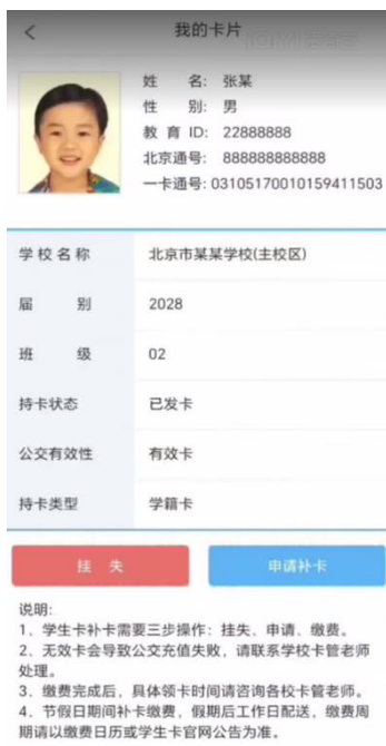
核对照片和学校名称等信息 (如信息有误请联系学校更新)